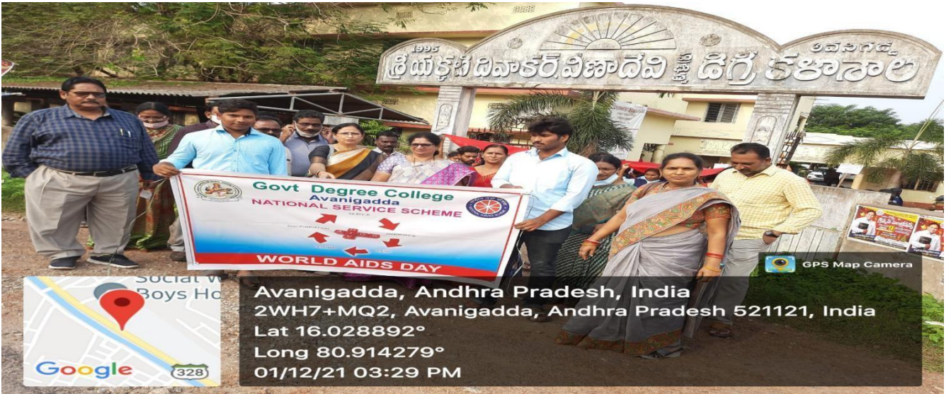
RALLY WAS STARTED BY THE PRINCIPAL