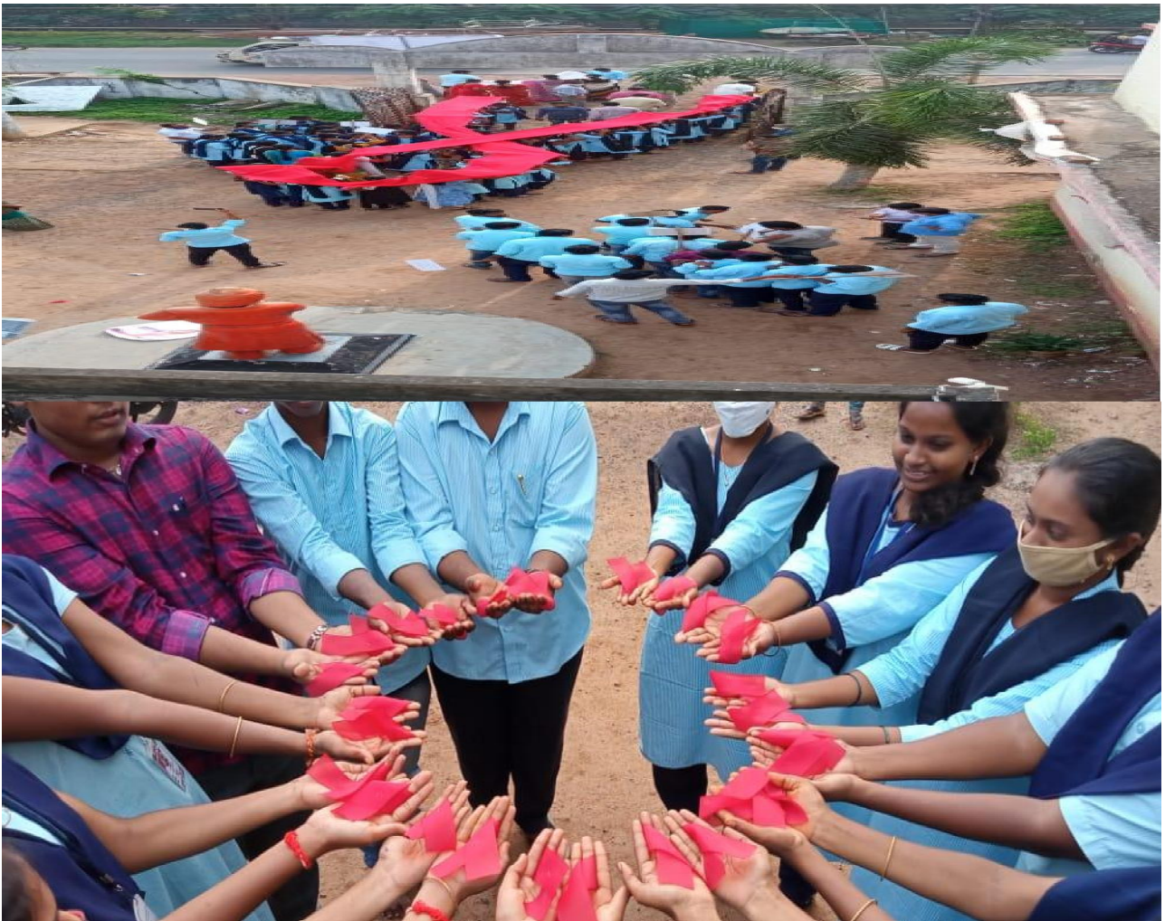
FORMATION BY STUDENTS