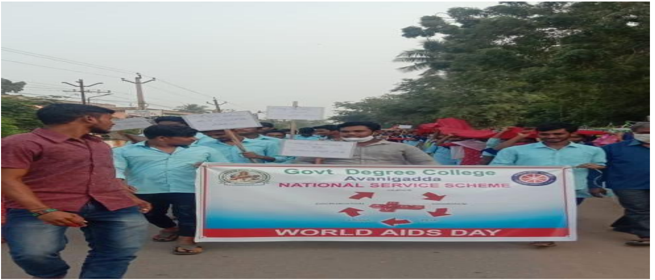
Rally with slogans on AIDS awareness